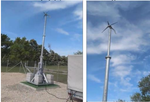
Слика 5. Ветрогенератор на преклопном стубу у радном положају