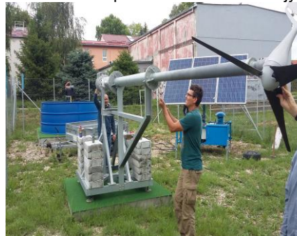
Слика 6. Ветрогенератор у положеном/преклопљеном положају