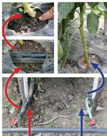
Кап по кап

конструкцијама припада прецизним и паметним технологијама (строго контролише потрошњу воде), док паметним технологијама припада јер има механизам саморегулације при давању воде биљкама.